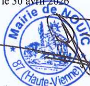
Le Maire, Frédéric REBEYRAT

POUR EXTRAIT CONFORME Nouic, le 30 avril 2026